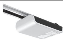
BLANC 800 Elettronica integrata Integrated control unit