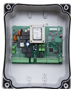
Unità di controllo BIOS2 230V BIOS2 230V control unit